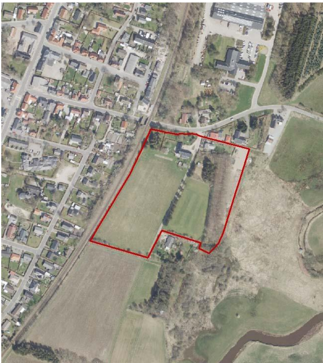
Kommuneplantillæggets afgrænsning er vist med den røde linje.

Det udpegede område, der ligger lige syd for Vesterbækvej og øst for jernbanen, udgør et areal på ca. 3,8 ha. og omfatter matrikel nr. 8b, 8bd, 8al, 8aæ, 8ap, og en del af 7t Sig By, Thorstrup.